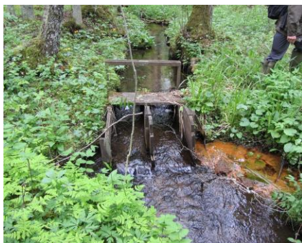
Det sammanlagda källflödet