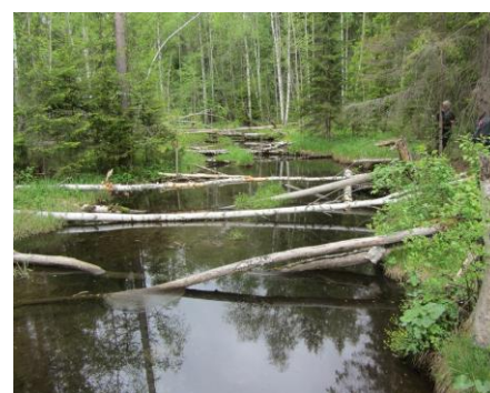
Källbäcken vid utloppet till Jädraån