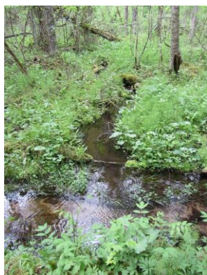
Årets källa Smörhålet , del av källområdet